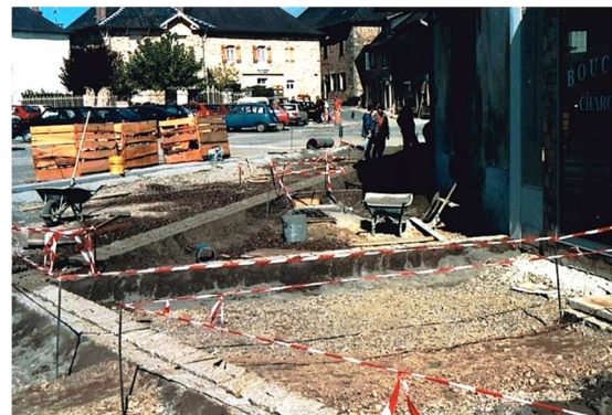
Assainissement, préparation réseaux et terrassement.