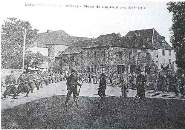
La place au début du XX ème siècle