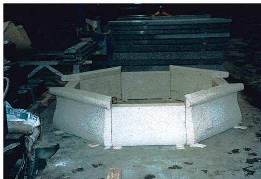
Préparations des blocs en marbrerie