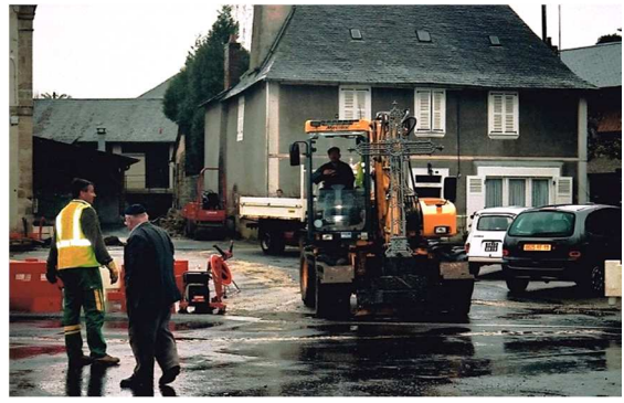
Démontage et transfert