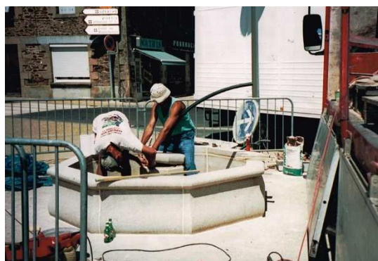
Pose sur site