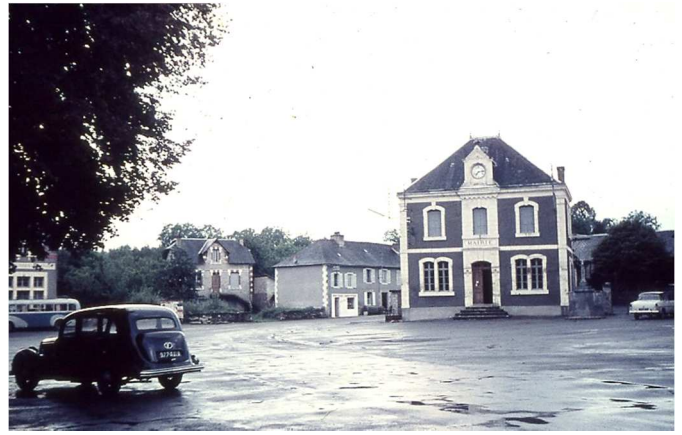
La place dans les années soixante