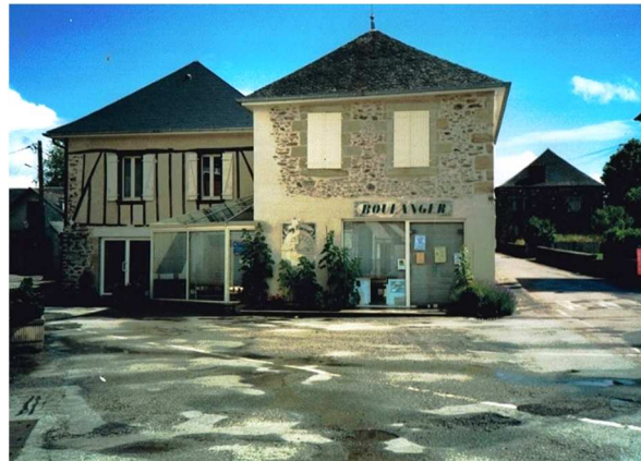
Vue partielle avant les travaux