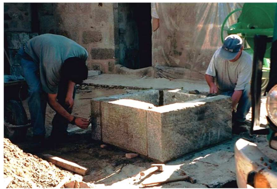
Repose à son nouvel emplacement près de l'église