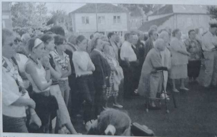
L'assistance présente sur la place de Lagraulière

Samedi 21 septembre à 11 heures, ce sera au tour du retable polychrome, réalisé par les frères Duhamel et qui vient d'être restauré, d'être inauguré. Une municipalité qui réalise son programme sans sectarisme avec pour souci le bien-être des Graulériens. ■