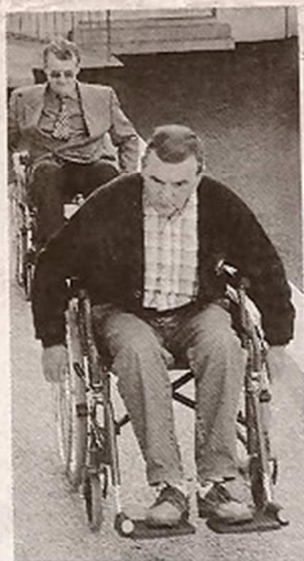
Les invités valides ont testé les aménagements en fauteuil roulant.

A la mairie de Lagraulière, l'APF et la DDE ont signé une charte de partenariat pour l'accessibilité en Corrèze. Une première en France qui témoigne d'un engagement en faveur des personnes à mobilité réduite. Une occasion pour tous de se mettre à la place de ceux qui ont des problèmes de déplacement et de les comprendre afin de créer un environnement ouvert à tous.