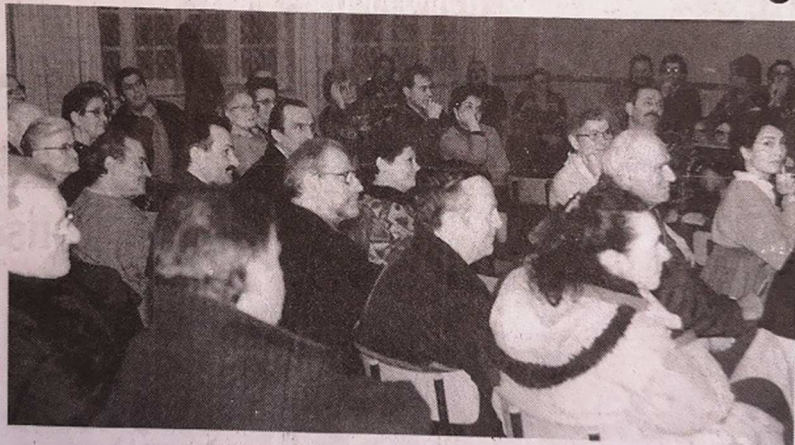
Les habitants à l'écoute des projets du bourg.

Les habitants de Lagraulière ont été invités à une réunion où la municipalité a présenté le plan d'aménagement du centre-bourg.