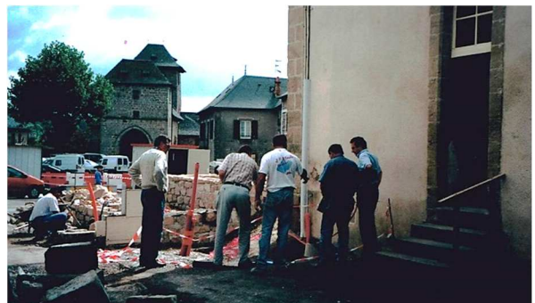
Maçonnerie et tracés