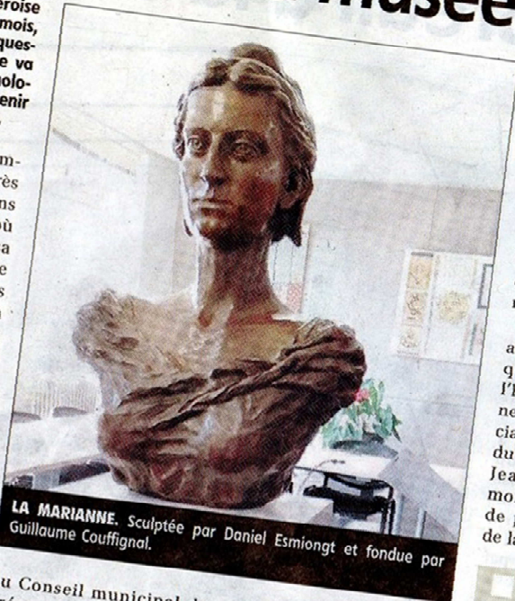
LA MARIANNE. Sculptée par Daniel Esmoingt et fondue par Guillaume Couffignal.

Elle a été mise en place dans la mairie de Lagraulière le 8 décembre 2001,