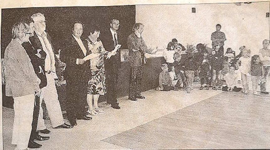
INAUGURATION. De nombreuses personnalités ont participé à l'inauguration de cette salle à l'histoire pas banale.