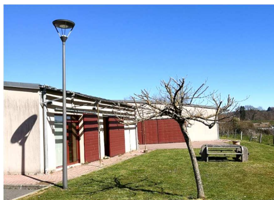
La salle polyvalente et la médiathèque aujourd'hui.